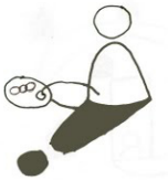
Ouverture d'esprit Mind opening 마음을 여는

Schématisés à l'extrême, ils deviennent des dessins symboliques, de petites cartes qui offrent des moments de respiration dans cette inflation de messages qui nous fait oublier le contenu au profit du nombre de contacts. Un retour par la simplicité dans la complexité du réseau.