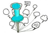
Paix Peace 평화

Revenons un instant à la question centrale de cette seconde rubrique : qu'est-ce qui est mis en scène par le performatif de l'interactivité ?