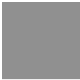
Figure 18 : La circularité inachevée du désir (source : Žižek 2001a, p. 56).

comme l'obstacle qui plonge la dynamique du désir dans un retour perpétuel sur lui-même. Žižek récapitule cette notion à de nombreuses occasions, dans plusieurs de ses ouvrages, notamment dans Enjoy Your Symptom! , où il décrit l'objet a comme « the reef, the obstacle which interrupts the closed circuit of the 'pleasure principle' and derails its balanced movement » (Žižek 2001a, p. 55). Il se réfère ensuite au schéma élémentaire lacanien dans lequel cette circularité est ainsi représentée :